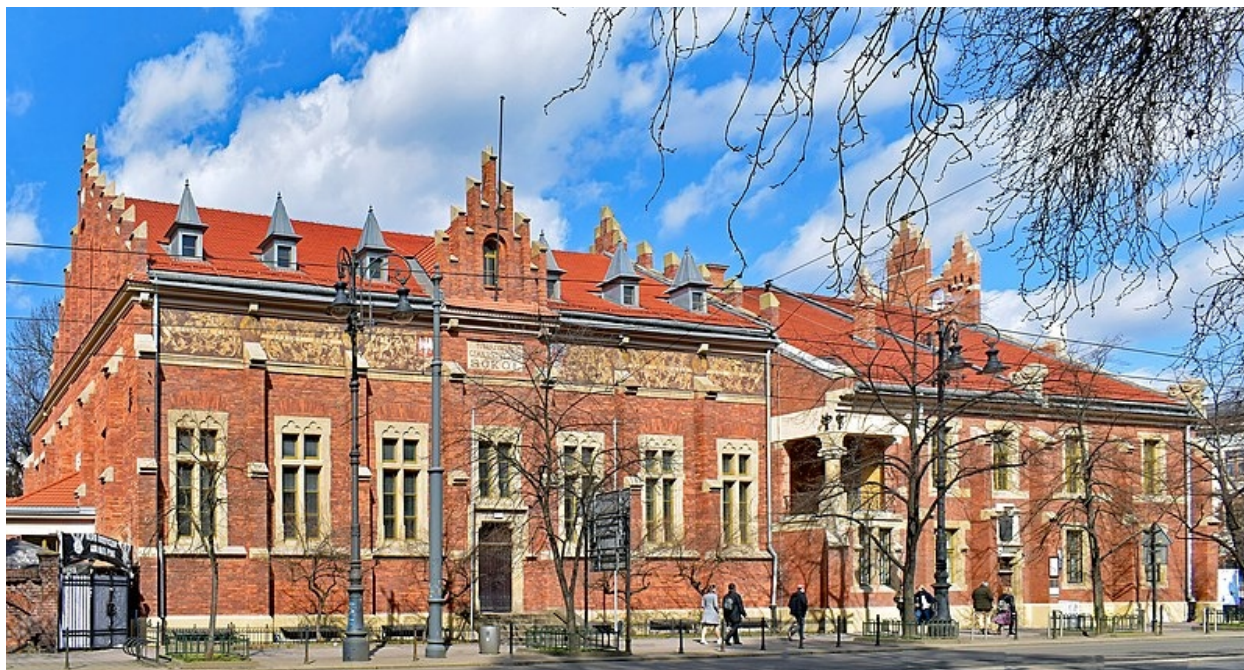
Budynek Towarzystwa Gimnastycznego „Sokół” w Krakowie

Sokolnia krakowska jest ulubionym miejscem spotkań patriotycznych od lat w Krakowie. To tutaj 10 lat temu ogłoszono Andrzeja Dudę Kandydatem na Prezydenta RP. Budynek sokolni krakowskiej powstał w 1889 wg projektu arch. Karola Knausa, a następnie został rozbudowany o wschodnią część przez arch. Teodora Talowskiego w 1894. Zabytkowy dzisiaj budynek mieści się przy ul. Piłsudskiego 27 w Krakowie.