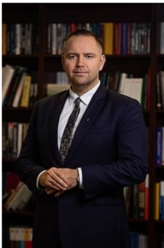
Dr Karol Nawrocki, Prezes Instytutu Pamięci Narodowej (IPN)